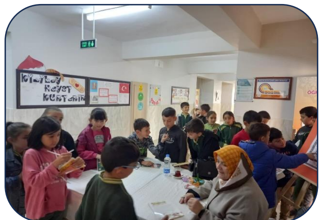
Okulumuza Yazar Ziyaretleri