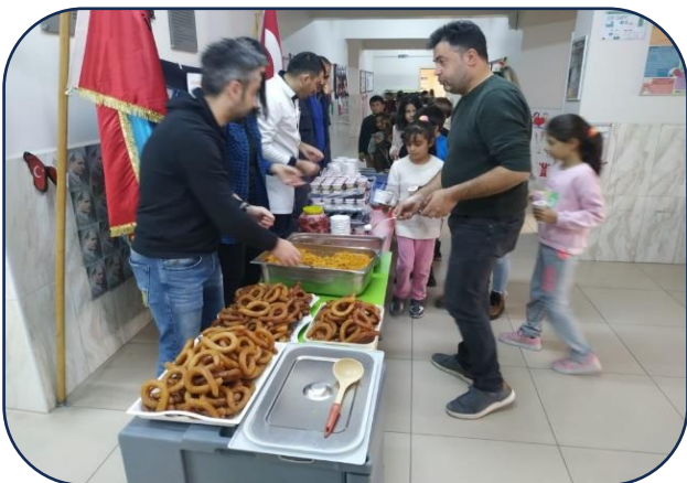
Geleneksel Pilav Etkinliği