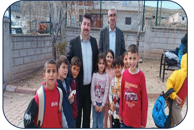
İlçe Milli Eğitim Müdürümüzün Okulumuza Ziyareti