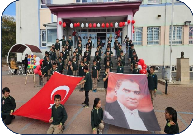
Öğretmenler Günü Programı