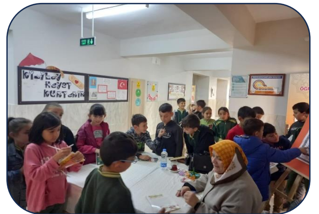
Okulumuza Yazar Ziyaretleri