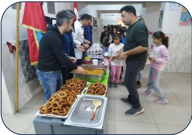
Geleneksel Pilav Etkinliği