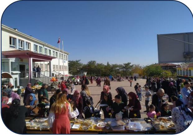
Kermes ve Çocuk Şenliği Programı