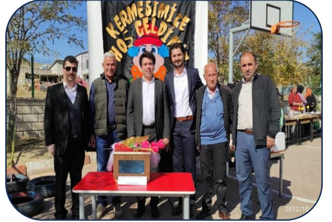
Okul Aile Birliğimiz tarafından düzenlenen kermes