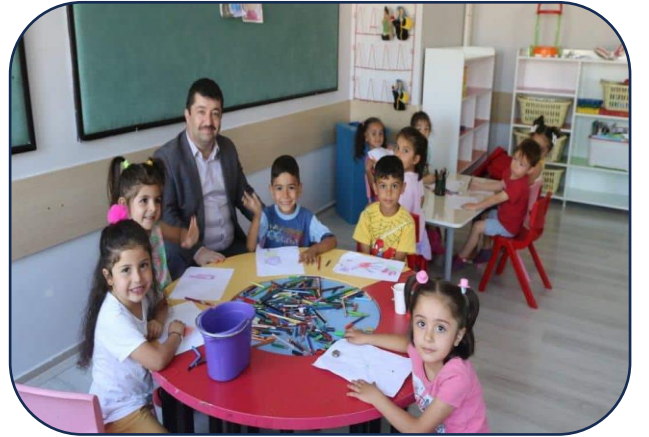
Okul Öncesi Portfolyo