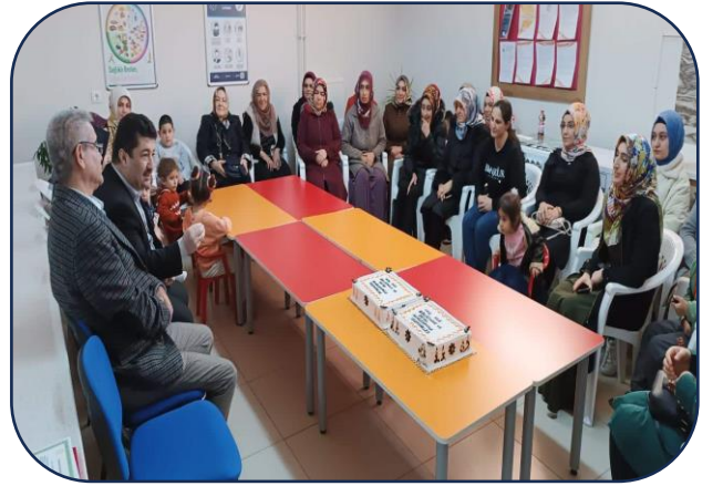
Okul Aile Birliği Plaket Programı