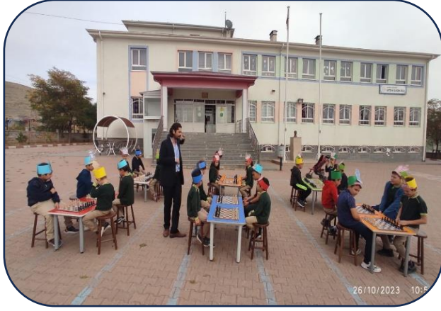
100. Yıl Satranç Turnuvası